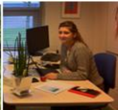
En travl dag i Herning. Her er vi i gang med at rette tekster til den nye hjemmeside.