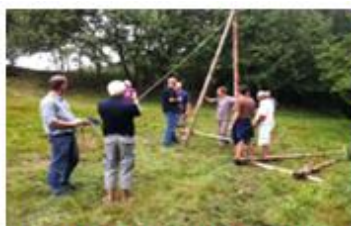
En anderledes arbejdsdag i Ree-park, som jeg deltog i.